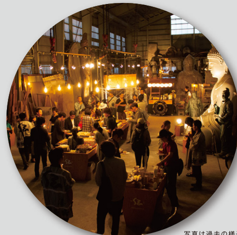
写真は過去の様子 (別会場)